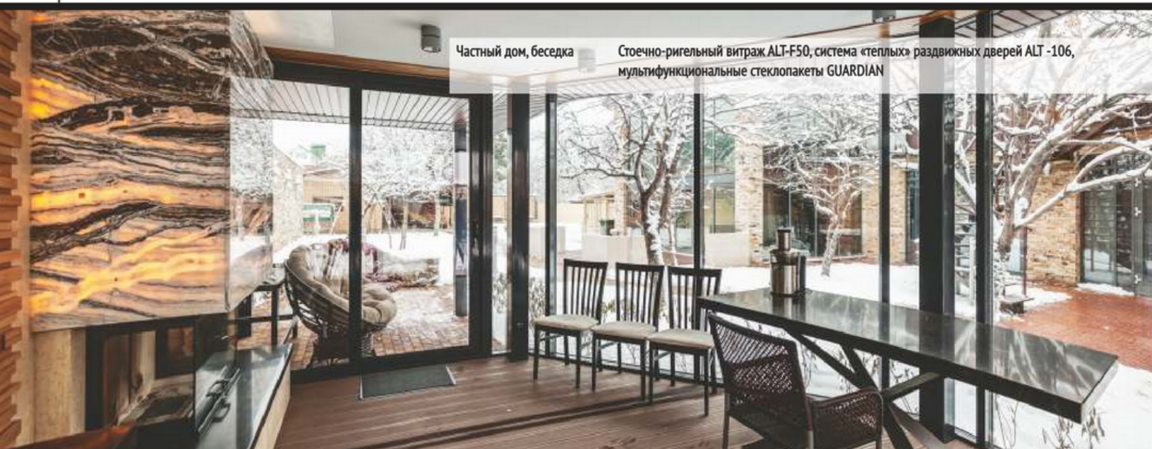
Частный дом, беседка

Стоечно-ригельный витраж ALT-F50, система «теплых» раздвижных дверей ALT-106, мультифункциональные стеклопакеты GUARDIAN